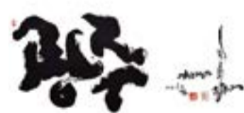
영원하라 오월 광주여 서예

틈’(문학들刊)을 펴냈다. ‘치밀한 빈틈’은 우리 시대의 위선과 거짓에 대한 고발이자 반성의 시집이다.