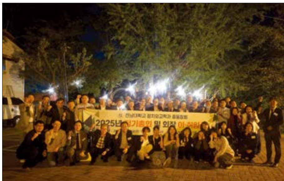
베네치아 지산 본점에서 열린 '2025년 정기총회 및 회장 이·취임식'

정치외교학과 동창회는 '2025년 정기총회 및 회장 이·취임식'이 4월 25일 베네치아 지산 본점에서 열렸다.