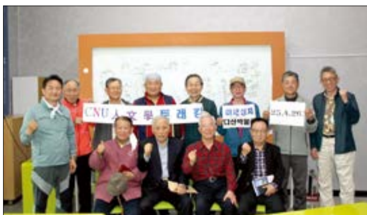
18년으로 구분된 그의 500여 권의 저서와 삶을 조명하며 후세 위정자들에게 끼친 영향력을 느끼는 뜻깊은 시간이었다”고 전했다. 한편 인문학트레킹회는 매월 넷째주 토요일에 정기 탐방을 진행하고 있다.

특강에 참석한 동문 회원들은 “다산의 성장기 18년, 영조와 18년, 강진 귀향 제자 양성