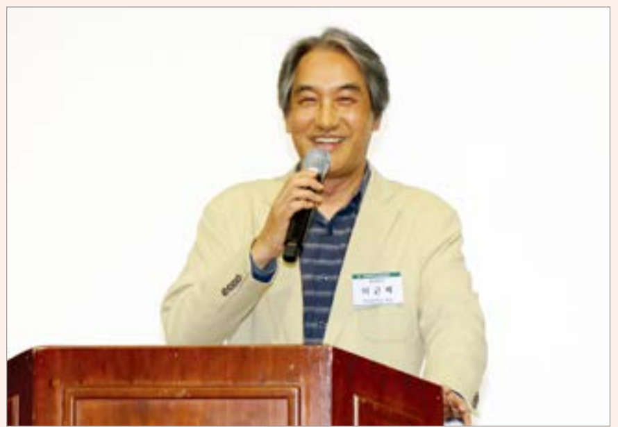
모교 이근배 총장