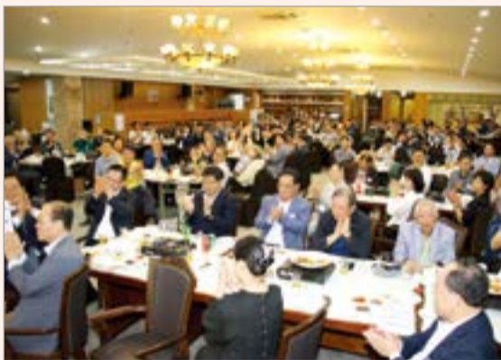
시상식 및 연회장 모습